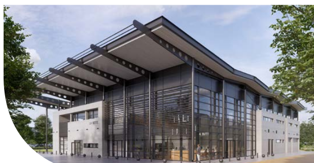
La Butte présentera un nouveau visage, plus ouvert, lumineux et en lien avec son environnement, en 2026.

Le projet de requalification de La Butte a été présenté aux habitant-es en novembre. Un projet qui vise à ouvrir plus encore le bâtiment vers l'extérieur et en direction de tous les publics.